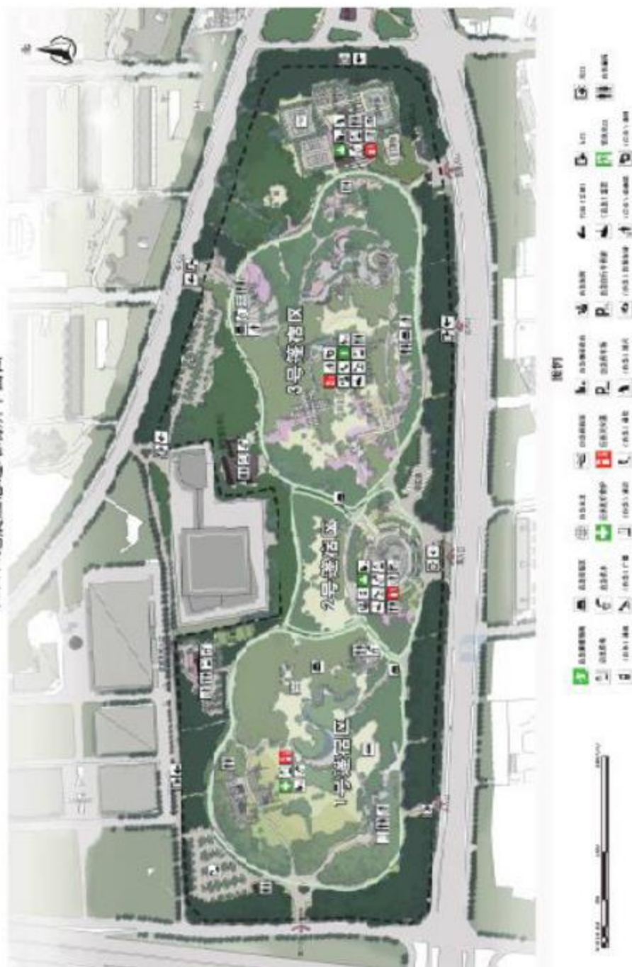
图 C.1 安置区域图示例