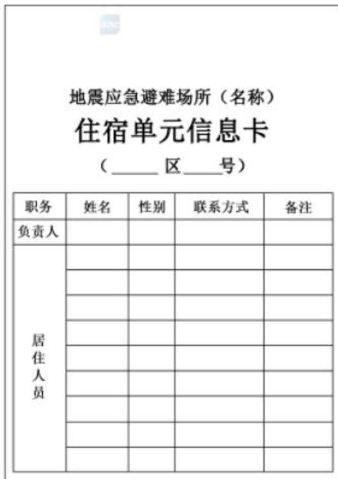
图 J.1 地震应急避难场所住宿单元信息卡

地震应急避难场所住宿设施管理单元信息卡模版样式见图 J.1,其中“地震应急避难场所(名称)”为对应的应急避难场所的实际名称,在制作时应用实际名称替换。