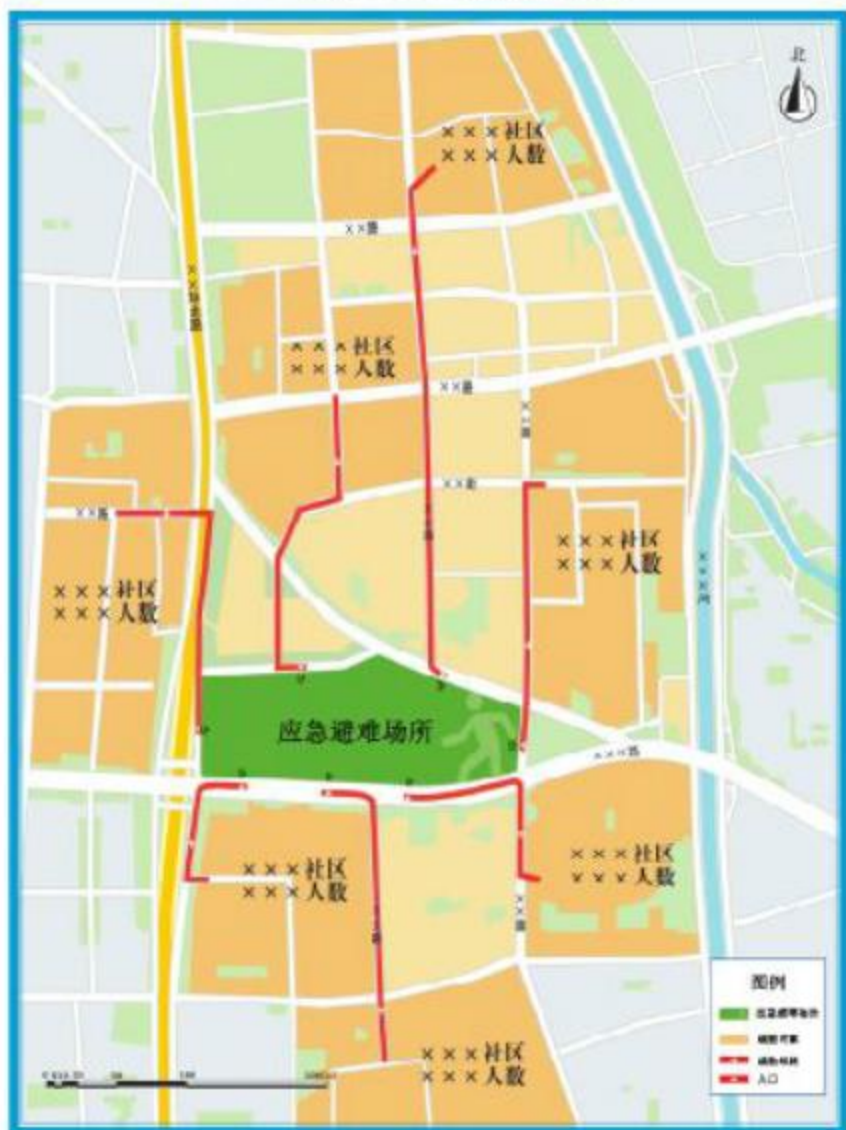
×××地震应急避难场所疏散路线图