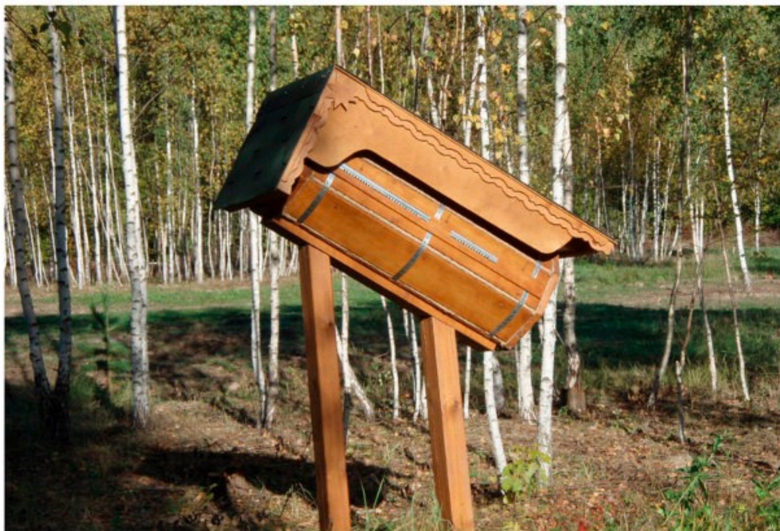
一名俄羅斯讀者建造的蜂巢。參考第 12 章。