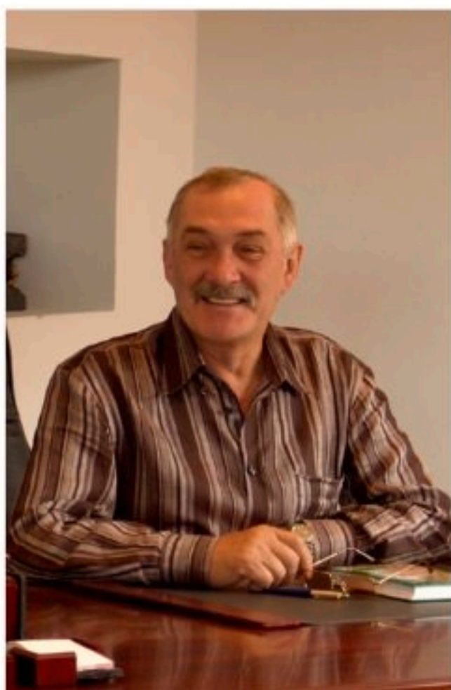
弗拉狄米爾·米格烈