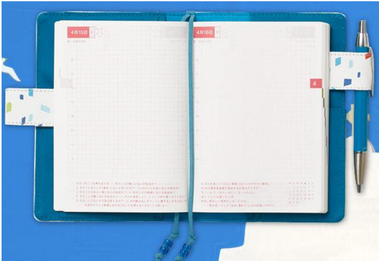
图 1 定页本示例（ほぼ日手帳：世界の伝統柄 ミコノスの窓）

手帐分为 定页 和 活页 ，定页就像我们平时阅读的书本，活页就是带有活页环、纸张可拆卸的本子。