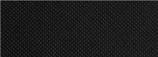
玄武黑打孔真皮内饰