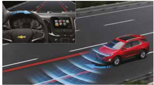
LDW车道偏离预警+LKA行道保持辅助