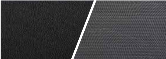
日冕黑PVC+冷月灰织物双拼内饰