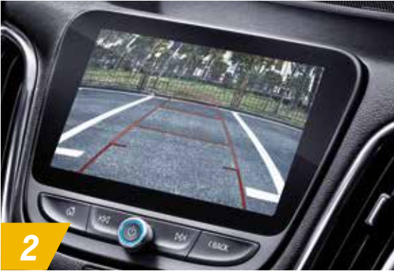
2 倒车影像 开阔视角可达130度,后方10米视野尽收眼底。同时匹配动态牵引线功能,确保倒车安全顺畅。