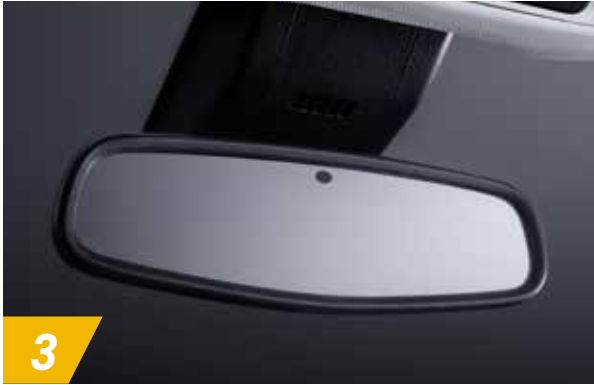
3 电子防眩目内后视镜 自动调节内后视镜亮度,避免后方强光干扰视线,保障行车安全。