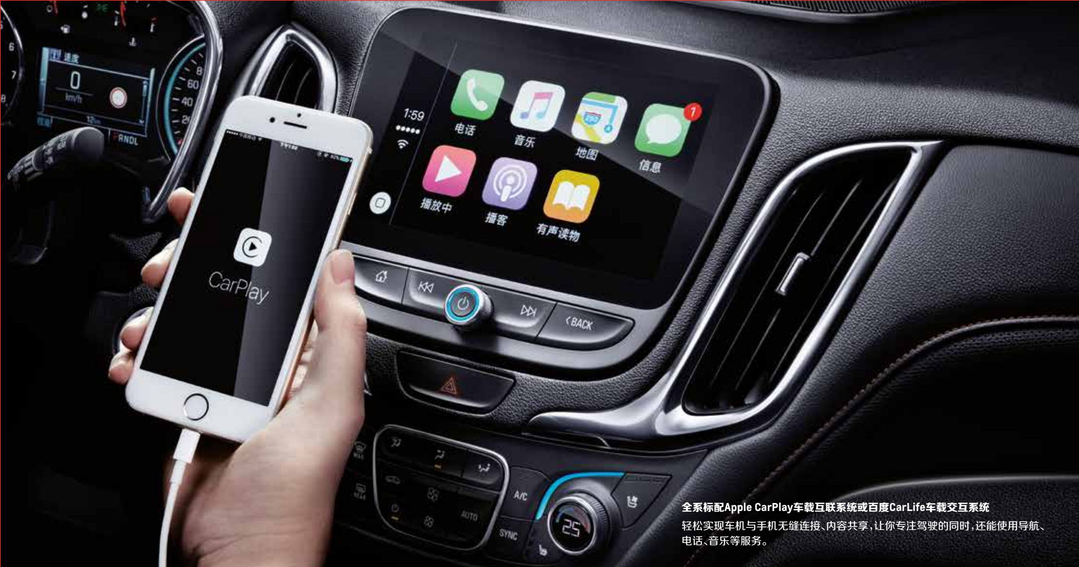
全系标配Apple CarPlay车载互联系统或百度CarLife车载交互系统 轻松实现车机与手机无缝连接、内容共享,让你专注驾驶的同时,还能使用导航、电话、音乐等服务。