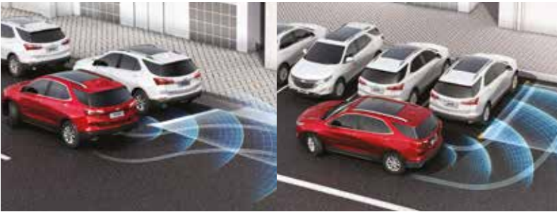
新一代APA自动泊车辅助