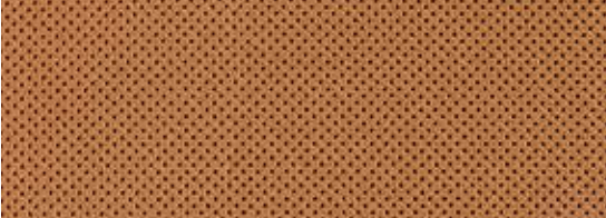
黄石棕打孔真皮内饰