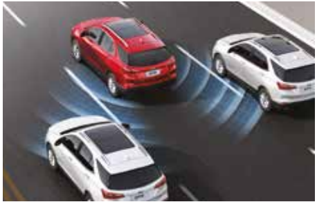
LCA车道变更辅助+SBZA侧盲区报警