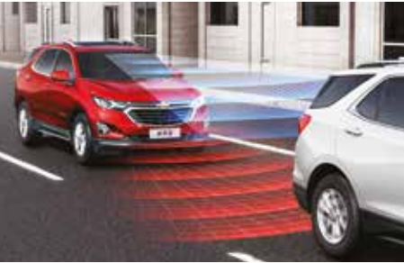
FCA前部碰撞预警+CMB碰撞缓解系统