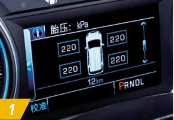
1 四轮独立式数显胎压监测 自动实时监测胎压并有数字显示,在轮胎状况异常时及时预警,保障车辆行驶安全。