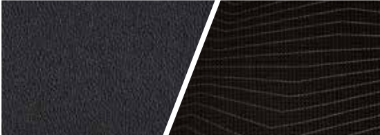
日冕黑PVC+鹰羽黑织物双拼内饰