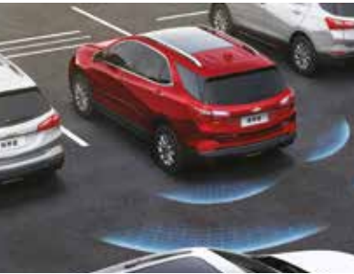
RCTA后方交叉路口提醒