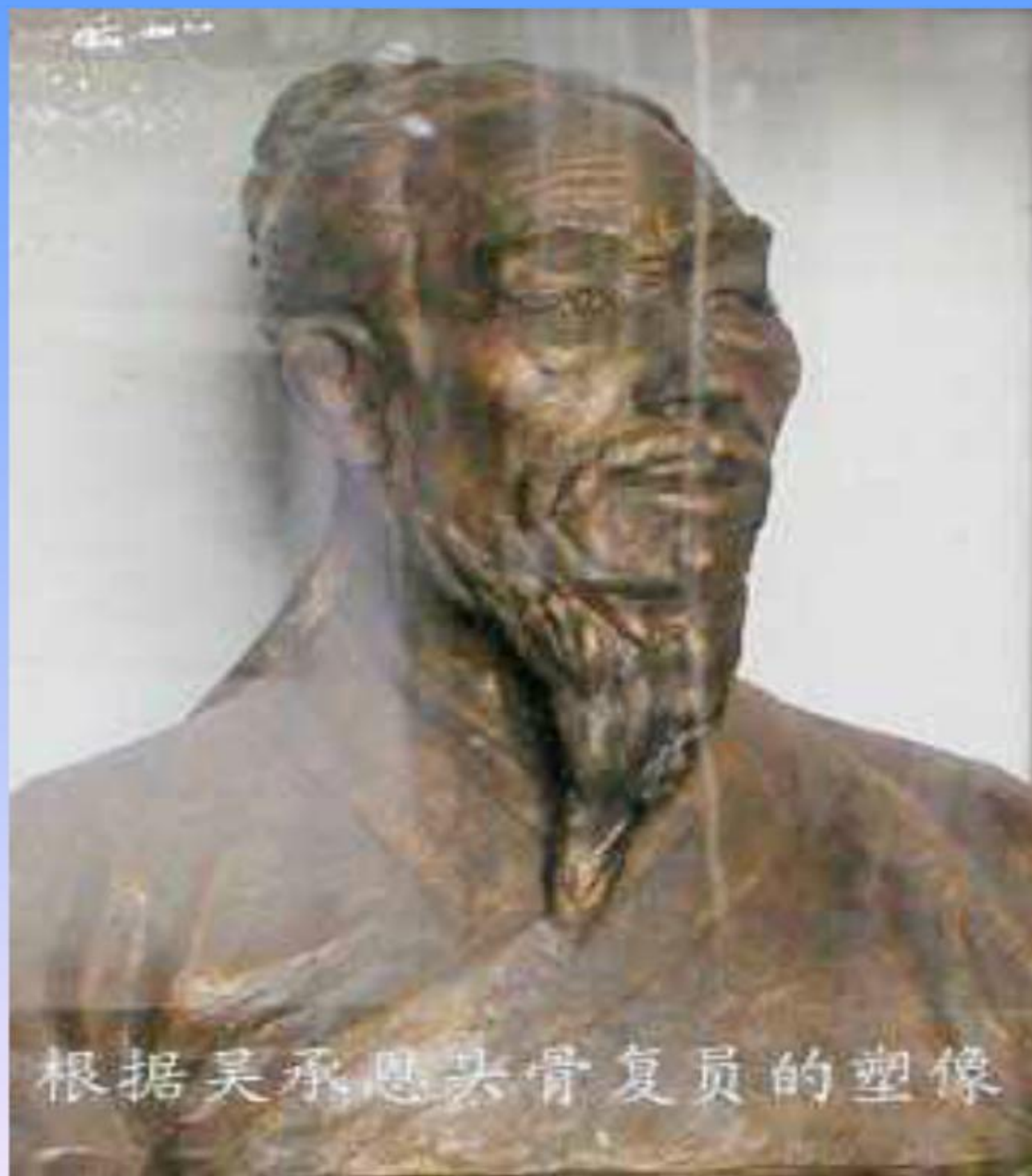
根据吴承恩头骨复原的塑像