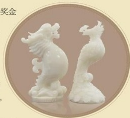
海马龙 | 海马凤

六、注意事宜：1.所有应征稿件，均须原创，且从未在省级以上报刊公开发表过；2.本次活动入围奖以上的获奖作品版权及相关权益归主办方所有；3.达到《故事会》发表水准的作品将在杂志上刊发；4.艺术瑰宝的相关资料，以及本次故事征集更多详情，请登录故事中国网(www.storychina.cn)或微博@故事会了解。